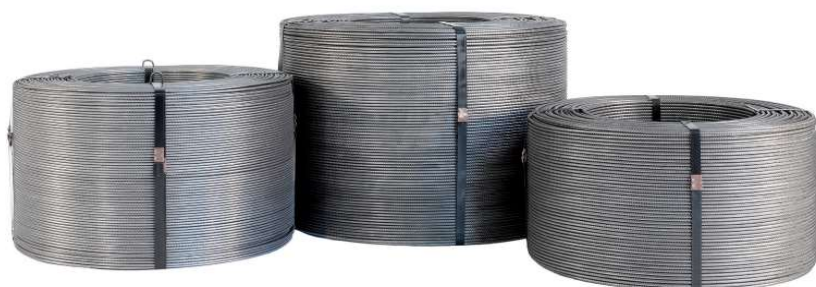
Tabella filo in bobina