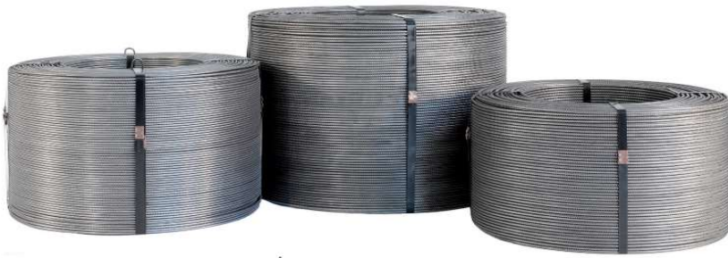
Tableau du fil en bobine